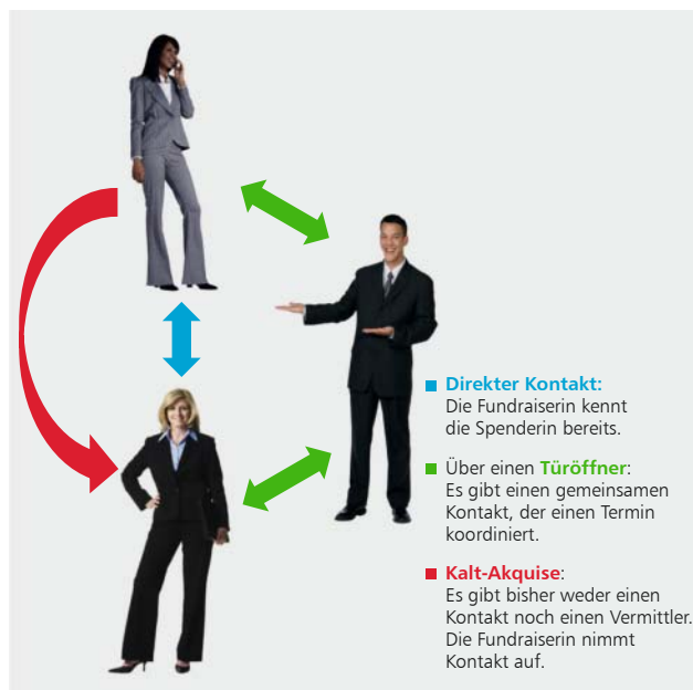
Abb. 2: Drei Wege zum Großspender

Vor der Kaltakquise haben viele Menschen eine hohe Hemmschwelle. Das liegt daran, dass bei zahlreichen Stiftungsmitarbeitern schon Vorbehalte gegen die Akquise an sich bestehen. Es klingt sehr nach verkaufen und hat daher oft ein schlechtes Image. Ein weiterer Grund liegt darin, dass es vielen Menschen schwer fällt, Geld zu thematisieren. Und noch schwerer ist es, fremde Menschen um Geld zu bitten, selbst wenn es um ein wichtiges Projekt der Stiftung geht.