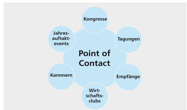
Abb. 3: Treffpunkt Veranstaltungen: „Im Leben ist es wichtig immer gute Kontakte zu haben und das nicht nur mit der Steckdose“ (Heinz Nitschke).

Zu fast jedem Thema und für fast jede Zielgruppe gibt es einen Fachkongress, eine Fachtagung oder eine Fachmesse. Bei der Auswahl hilft es, einen Blick auf die Teilnehmer dieser Veranstaltungen zu werfen und diese mit den Zielprofilen der gesuchten Großspender abzugleichen. Dazu können bereits Wochen vor der Veranstaltung die Programme online eingesehen werden. Auch die Redner und Referenten sind im Programm genannt. Nicht selten findet der Fundraiser hier die potenziellen Großspender für die Stiftung.